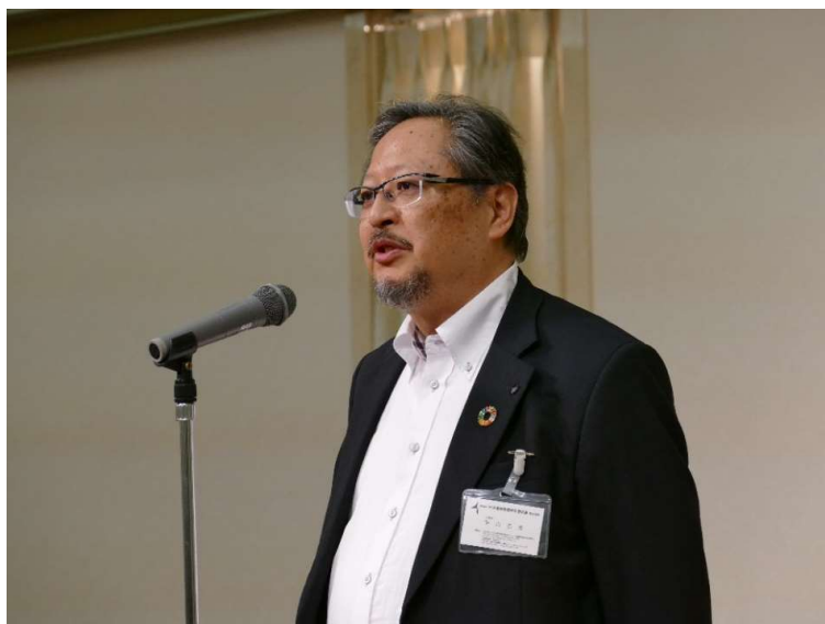
平山支部長からご挨拶