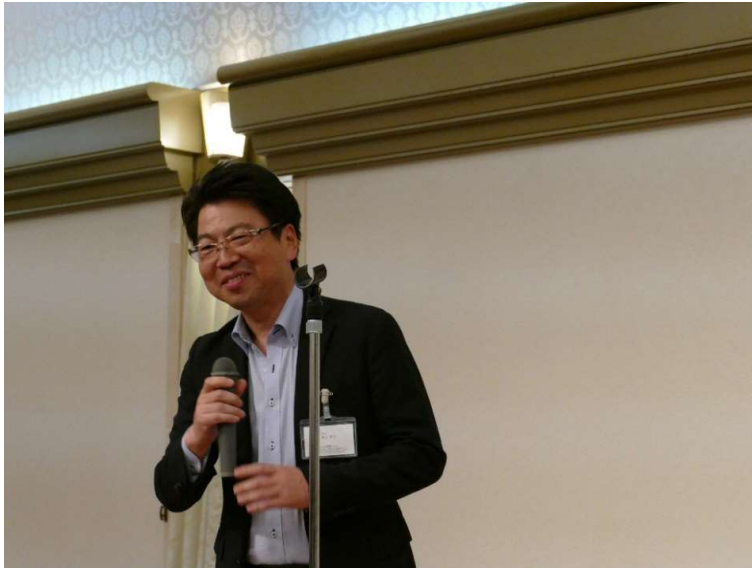
奥山副支部長から中締め挨拶

通常総会後の懇親会は4年ぶりに開催することができ、全ての行事が無事終了しました。