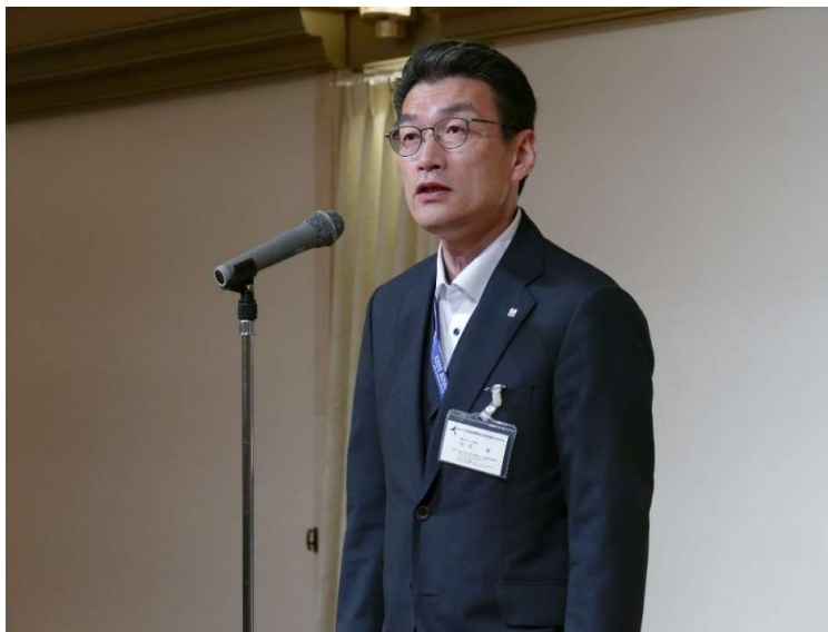
支部役員から挨拶 成田副支部長