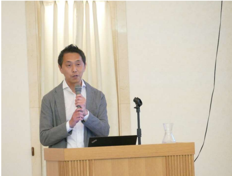
講演後に質疑応答を行い 終了した