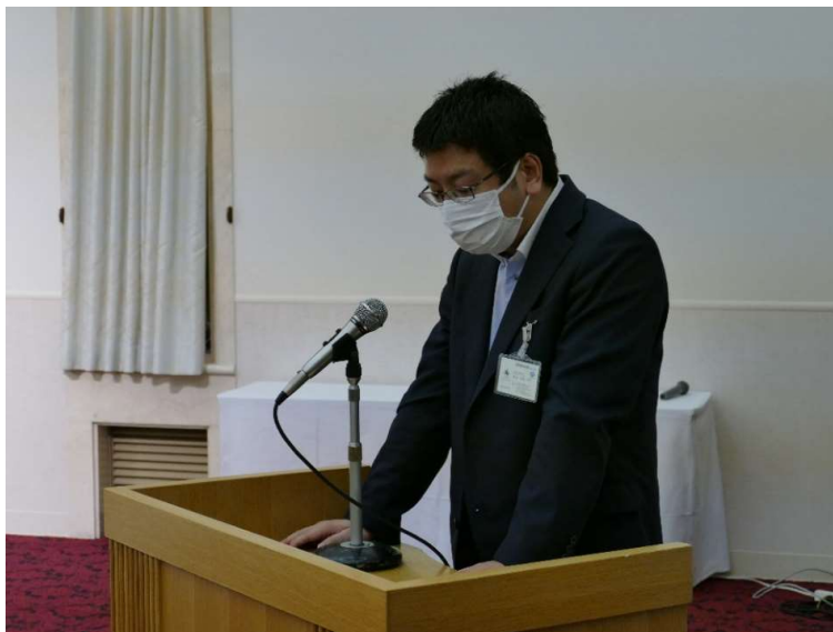
広報委員会の熊谷副委員長 の司会で懇親会開始