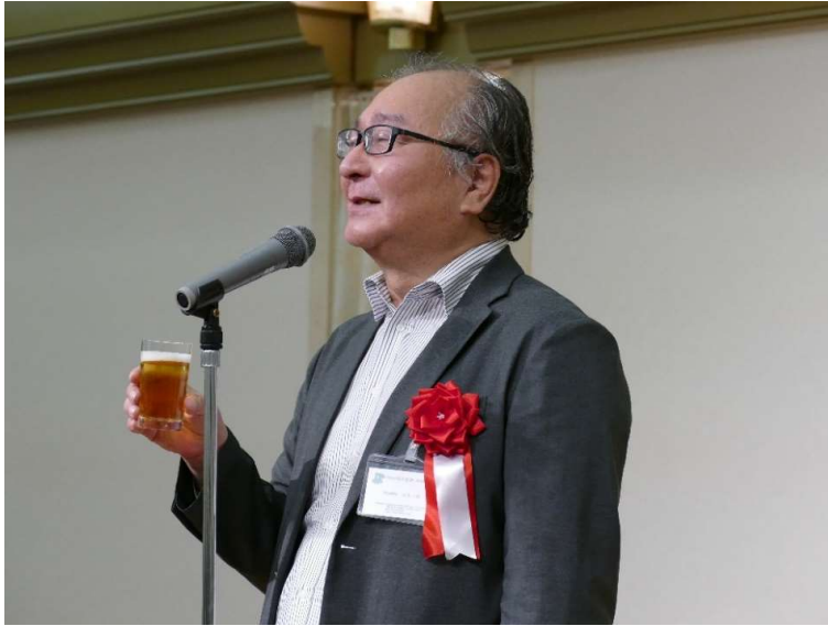
山内支部顧問から乾杯のご発声